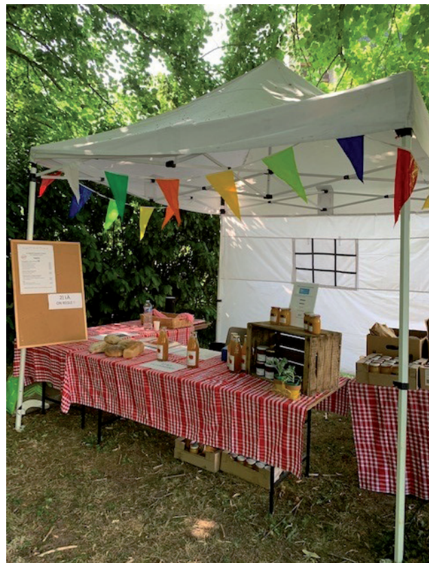
Pause gourmande du Terroir, Agence Gastronomie & Company