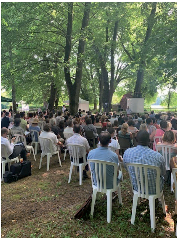
Matinée institutionnelle animée par le Réseau Gesat

Remerciements au Pôle 49 de La Résidence Sociale d'avoir accueilli cet événement et merci à tous les participants, partenaires et bénévoles de s'être mobilisés pour cette journée instructive et riche en partage.