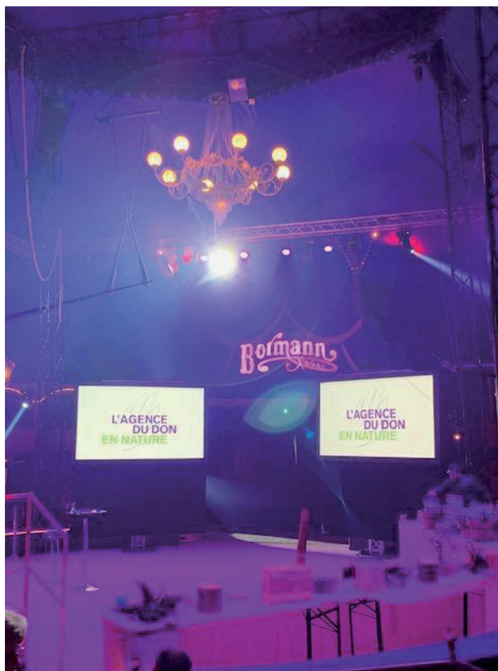
Événement annuel ADN en mars 2019 - sous le chapiteau du Cirque Bormann

Le jeudi 28 mars 2019, l'Agence du Don en Nature a célébré ses 10 ans au Cirque Bormann Moreno à l'occasion de la semaine du Don en Nature et de la lutte contre la précarité des enfants. La Résidence Sociale, partenaire de longue date, y était invitée pour soutenir ADN qui a souhaité dédier cet événement aux 3 millions d'enfants en situation de grande précarité en France, sous le thème #dessinemoiundon.