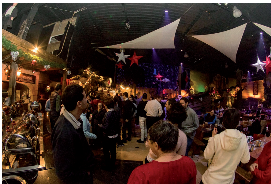
Événement de fin d'année au Repère des Pirates, fin janvier 2019

Comme chaque année, 2019 a été rythmée par de nombreuses formations pour les personnels et pour les usagers. La seconde journée nationale du « DuoDay » s'est déroulée le jeudi 16 mai 2019. L'établissement y a participé, en étroite collaboration avec l'enseigne LEROY MERLIN de Rueil Malmaison. Deux usagers ont été concernés par cette opération, chacun travaillant dans des services différents, l'un au service clientèle et retour de marchandise et le second dans le secteur administratif.