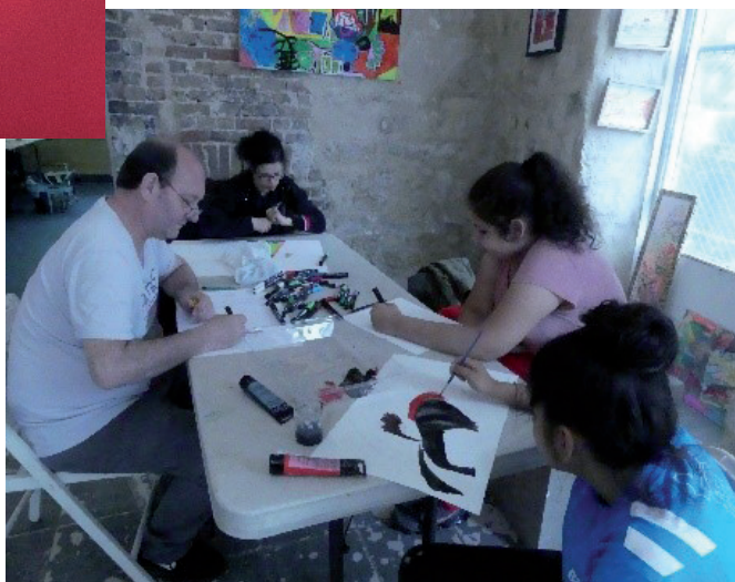
Projet de boutique inclusive pour les usagers de l'Atelier d'Art Créa de l'ESAT Marville (en partenariat avec la Mairie de Stains et les associations locales)