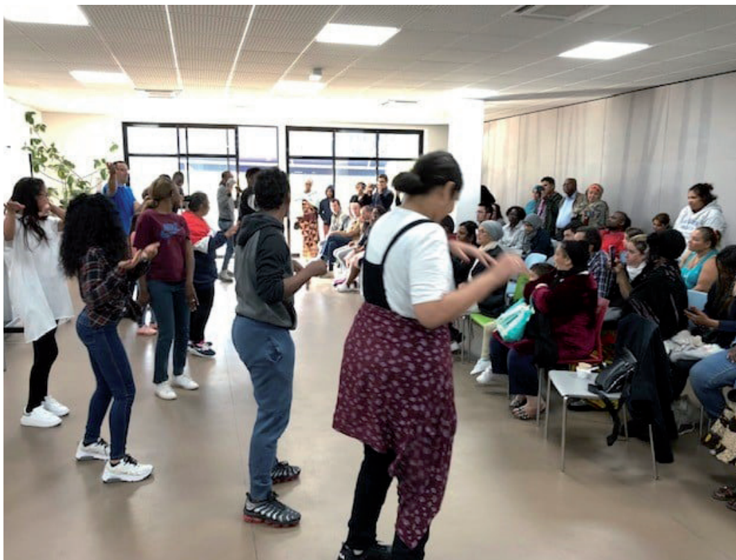
Le premier «Café des Parents» de l'EMPro, et l'intervention de l'Association Hip-Hop Art de Stains, septembre 2019

Cinq jeunes sont sortis en 2019. 4 ont intégré un ESAT et 1 jeune a souhaité quitter l'établissement qui ne semblait plus correspondre à ses attentes ni à celles de sa famille.