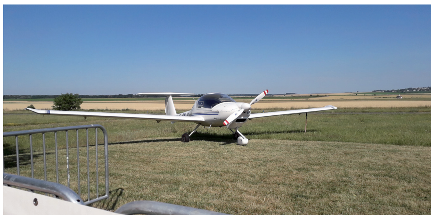
Baptême de l'air, Kiwanis

Accueil de stagiaires, formation : l'accueil d'éducateurs ainsi que de lycéenne en formation pour la réalisation de stages de découverte et à responsabilité éducative permet de créer une dynamique conduisant l'équipe éducative à une réflexion sur sa pratique professionnelle.