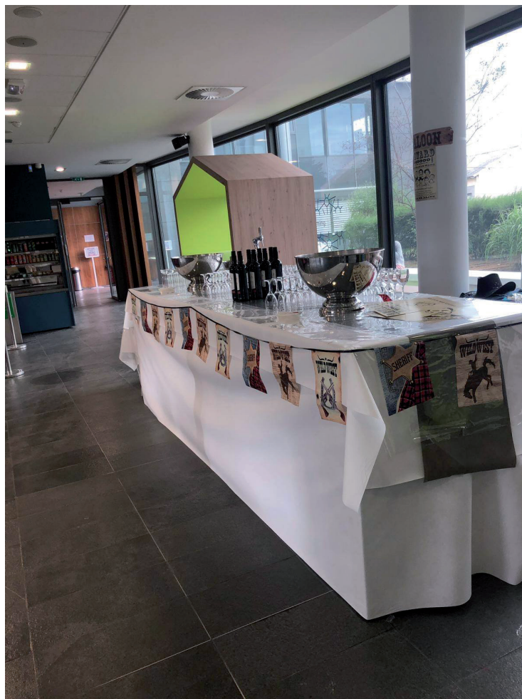
Prestation traiteur au siège du groupe Ayming France, juillet 2019

L'année 2019 a connu ses sorties traditionnelles, en période estivale et sur les fêtes de fin d'année. Pour clôturer le premier semestre et profiter des chaleurs de l'été, La péniche Mangareva à Saint Cloud, a accueilli l'ensemble du personnel de l'ESAT et ses usagers, pour une journée cocktail et après-midi dansante. Quant à la sortie de fin d'année, restaurant et après-midi au club discothèque « l'Escale » à Port Marly.