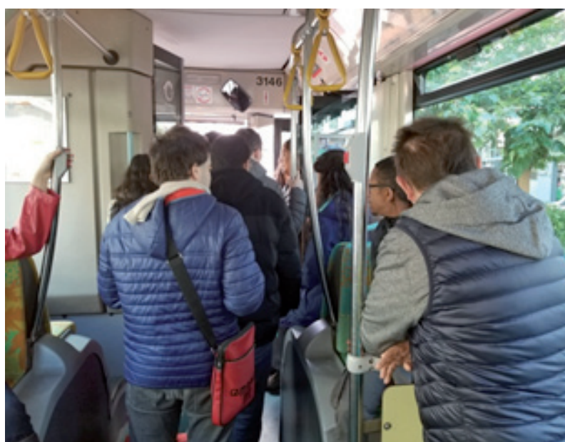
Journée de prévention à la sécurité routière, Rueil-Malmaison

À l'occasion de la fête des mères ainsi que dans le cadre de la semaine du handicap, des ventes ont été organisées à France ô en mai et en novembre 2019. Les objets mis en vente avaient été créés par les personnes accueillies au CAJ au cours de différents ateliers encadrés par la psychomotricienne et les éducateurs (mosaïque, couture, activités manuelles, poterie).