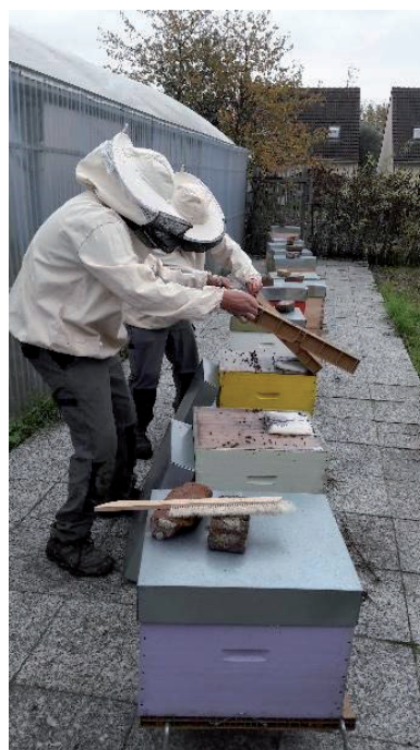
Visite de contrôle des ruches par les usagers