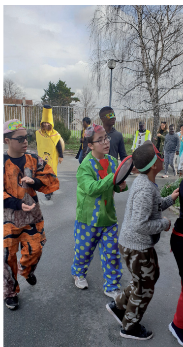
Carnaval du Mardi Gras, mars 2019

Spectacle de fin d'année par la compagnie du petit poucet « Le voyage de Sidonie »