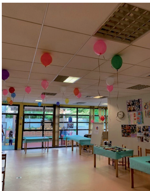
Journée Portes Ouvertes en juin 2019

Se poursuivent des actions de partenariat initiées en 2019 pour inscrire au plus près les jeunes à la citoyenneté. Un partenariat avec France Bénévolat permettra à partir de nouveaux projets et de co-construction avec d'autres partenaires de développer l'action citoyenne des jeunes de l'EMP. Un rapprochement est également envisagé avec La Fondation Cognac Jay pour consolider l'activité médicale au sein de l'EMP via l'intervention de 2 praticiens hospitaliers de l'institut Franco-Britannique. Enfin le programme de supervision et d'accompagnement à la formation aux techniques et aux accompagnements spécifiques à apporter aux jeunes TSA se déploiera selon le programme engagé.