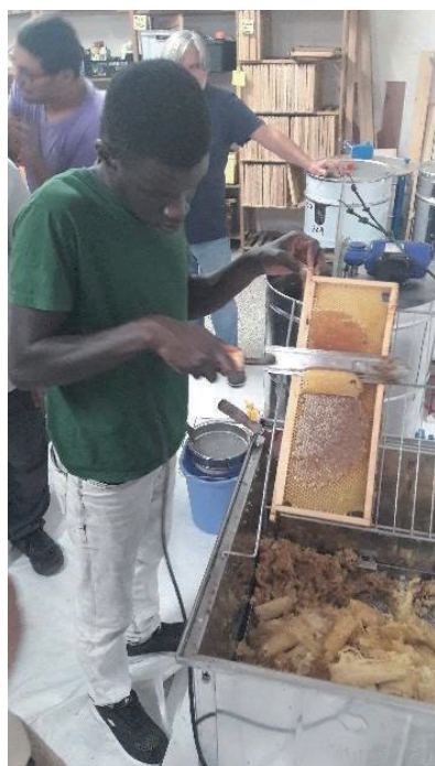
Récolte de miel à l'ESAT Marville

Pour couronner l'année 2019, l'équipe a obtenu la médaille d'or au concours des miels d'Ile de France. Ce grand succès récompense l'engagement et le professionnalisme de l'équipe d'apiculteurs de La Ferme des Possibles.