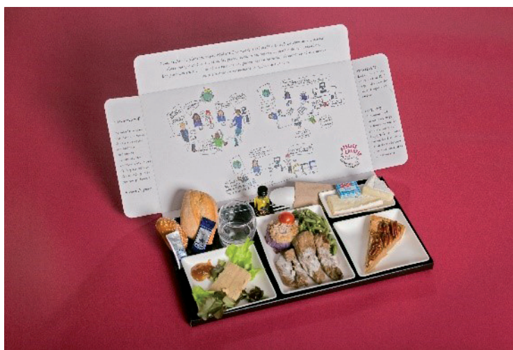
Réalisation d'une bande dessinée autour de la démarche RSE sur les couvercles des plateaux-repas, sous la marque «Ateliers Gourmands»

En 2019, l'équipe de l'ESAT Marville a obtenu la Médaille d'Or au concours des miels d'Ile-de-France. Ce grand succès récompense l'engagement et le professionnalisme de l'équipe d'apiculteurs de La Ferme des Possibles, notamment grâce au don de la Fondation Kronenbourg, qui a permis le développement des ruchers.