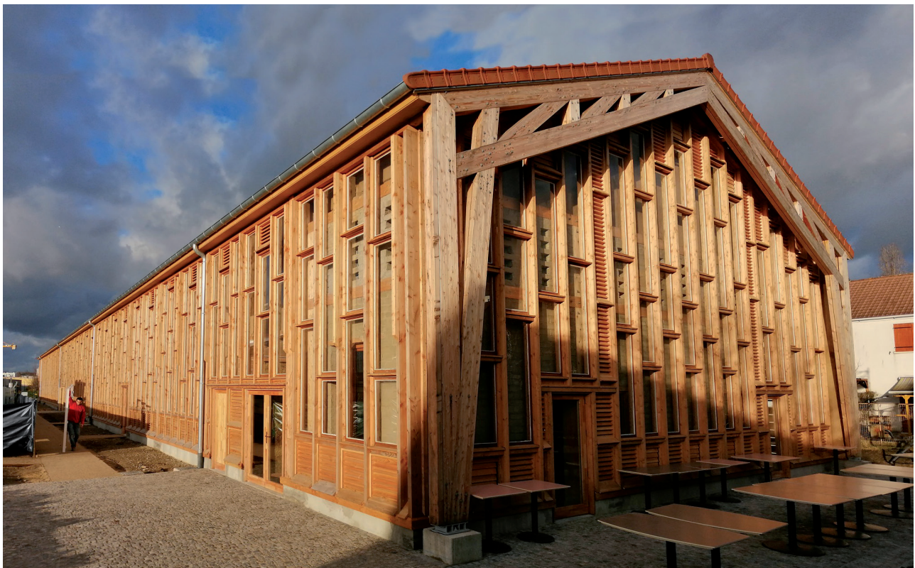
Le bâtiment bioclimatique « Résilience », construit fin 2019 sur le site de La Ferme des Possibles®

Cette installation est également en lien avec le projet de construction d'une serre pédagogique et du nouveau bâtiment bioclimatique Résilience, construit fin 2019 sur le terrain de la Ferme des Possibles. Ce bâtiment abritera le futur siège social de Novaedia ainsi que la Direction du Pôle 93.