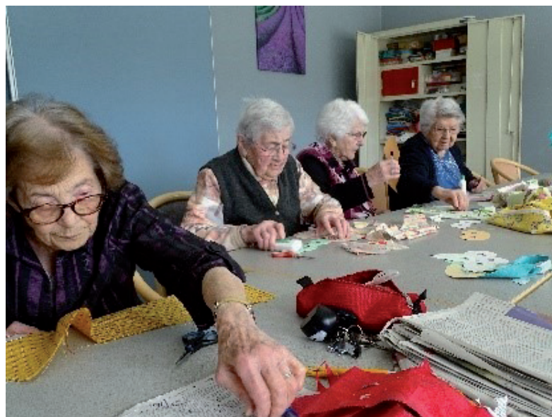
Atelier bricolage et confection de masques et costumes vénitiens, mai 2019

En 2019, 18 nouveaux résidents ont fait leur entrée dans l'établissement (dont 4 en accueil temporaire et 1 personne arrivant d'EHPAD) et 13 autres sont partis. L'accueil temporaire a très bien fonctionné avec 3 résidentes qui ont souhaité rester dans l'établissement de façon permanente. Cette année, de nombreuses activités d'animations ont eu lieu dans l'établissement notamment des activités inter-générationnelles en lien avec 4 jeunes de l'organisme UNICITÉ et la Maison d'Assistante Maternelle de Bauné (MAM). En novembre 2019 a eu lieu la journée des aidants au Château de Briançon et un jardin partagé avec 5 voisins a été créé pour permettre aux résidents de réaliser des plantations (tomates cerises, persil ...) et de partager des moments collectifs avec des personnes extérieures.