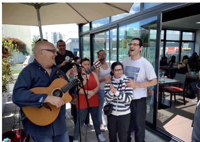
Spectacle musical de l'ESAT Marville au restaurant l'Atelier, juillet 2019

Une enquête de satisfaction a été diffusée auprès des usagers : fort taux de participation et résultats très satisfaisants sur la qualité de l'accompagnement. Quelques axes de progrès identifiés ayant fait l'objet d'une réflexion en équipe pluridisciplinaire, et inscrits au PACQ (Plan d'Amélioration Continue de la Qualité).