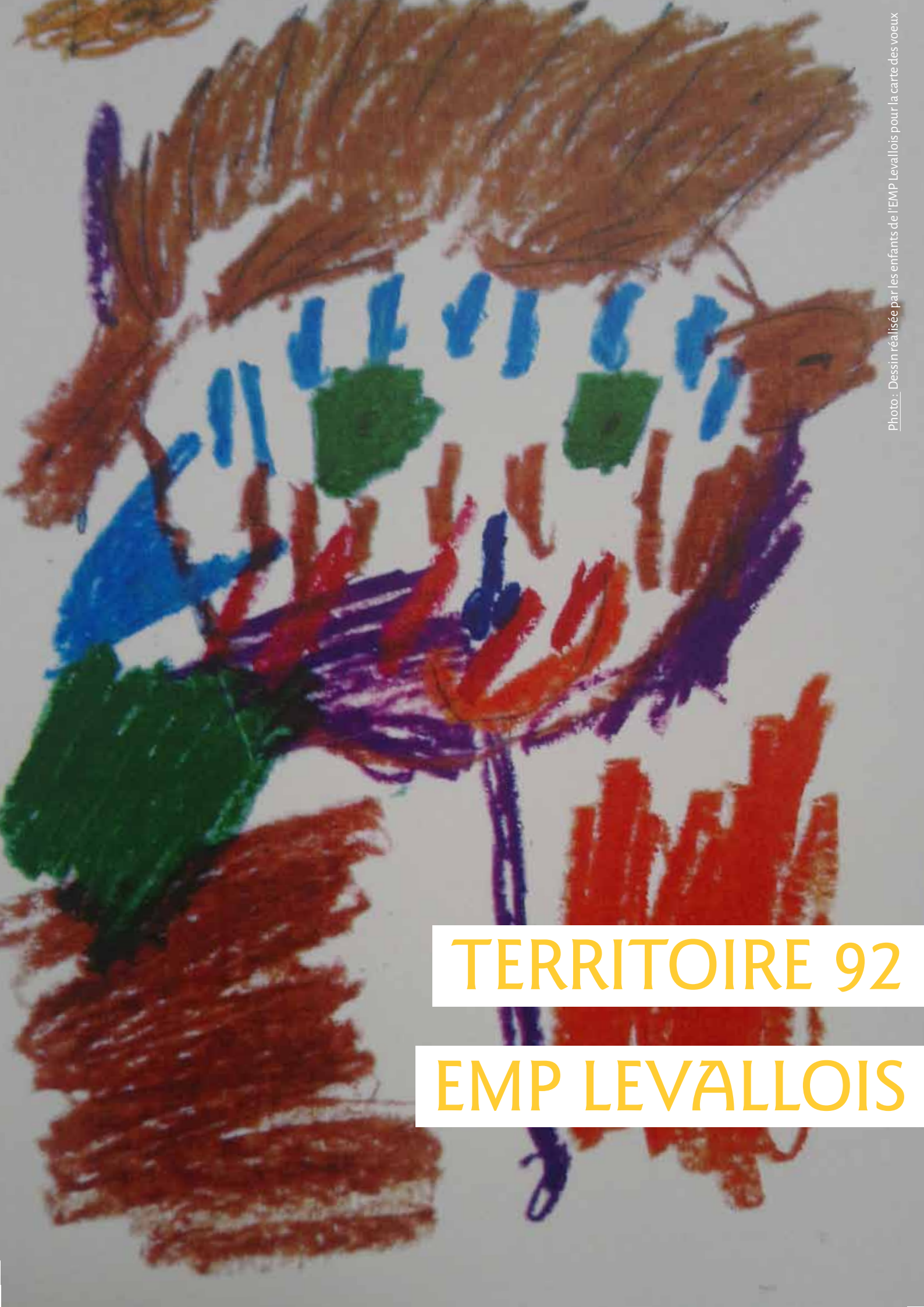
Photo : Dessin réalisée par les enfants de l'EMP Levallois pour la carte des vœux