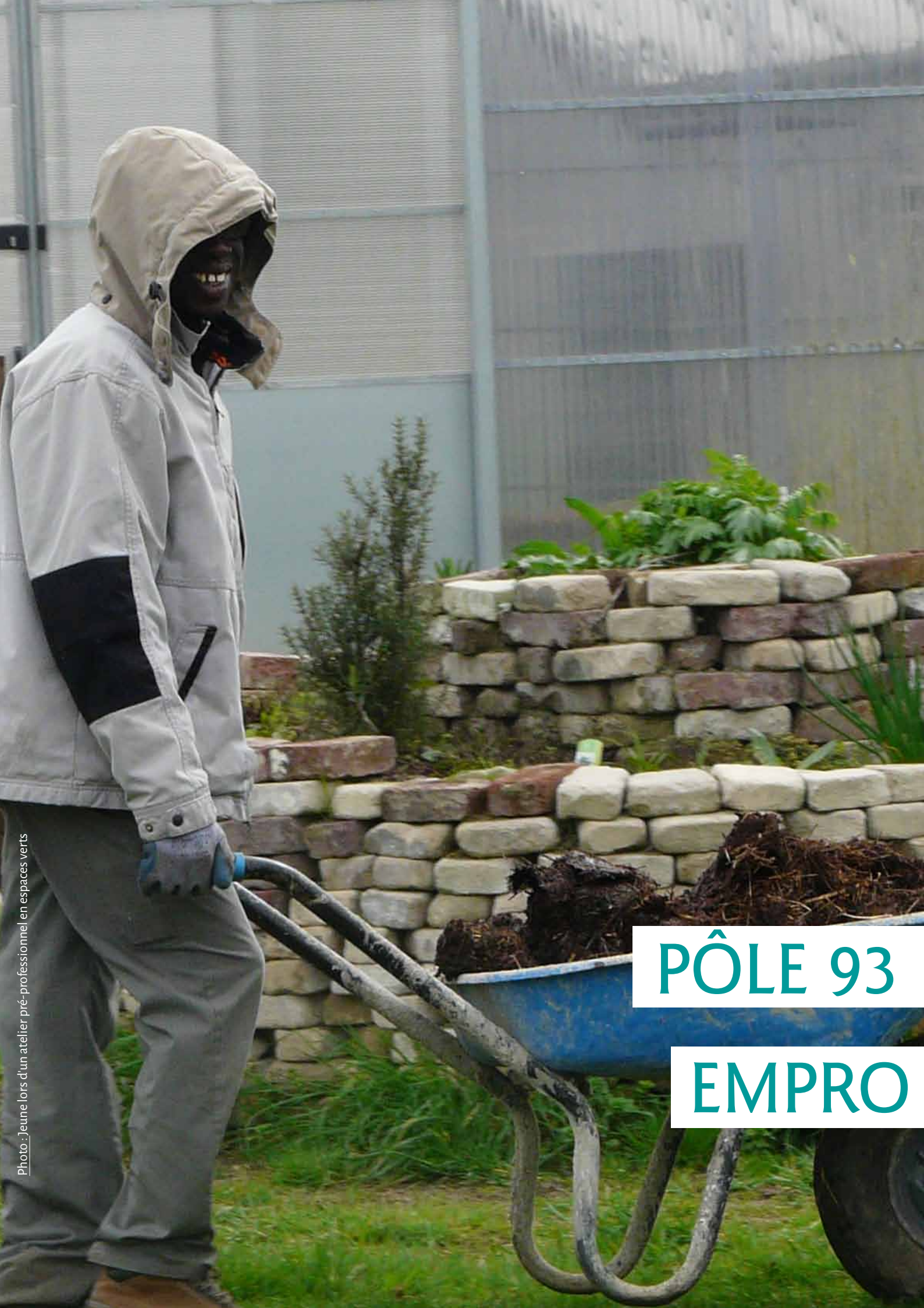
Photo : Jeune lors d'un atelier pré-professionnel en espaces verts