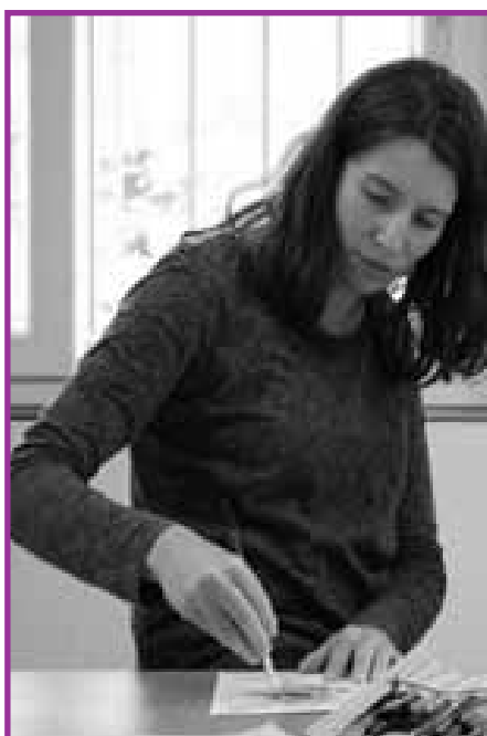
Photos : artistes présents au Château de Briançon