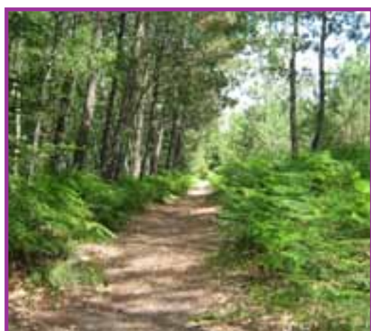
Photo : Forêt dans le parc du Château de Briançon