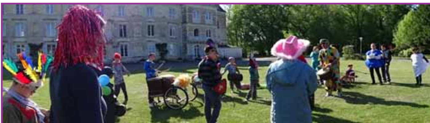
Photo : Animations au Château de Briançon

En parallèle, après l'ouverture en 2013, d'une classe externalisée de l'IME en primaire à St Sylvain d'Anjou, une classe au Collège de Seiches sur le Loir a vu le jour à temps partiel . Mais, il manque du personnel éducatif pour venir en soutien afin d'ouvrir de manière plus permanente. Cette expérience nouvelle est aujourd'hui positive et a besoin d'être soutenue dans la durée.