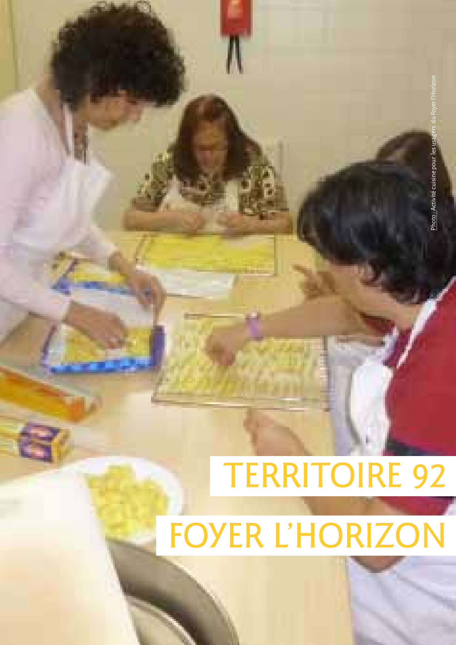
Photo : Activité cuisine pour les usagers du Foyer l'Horizon