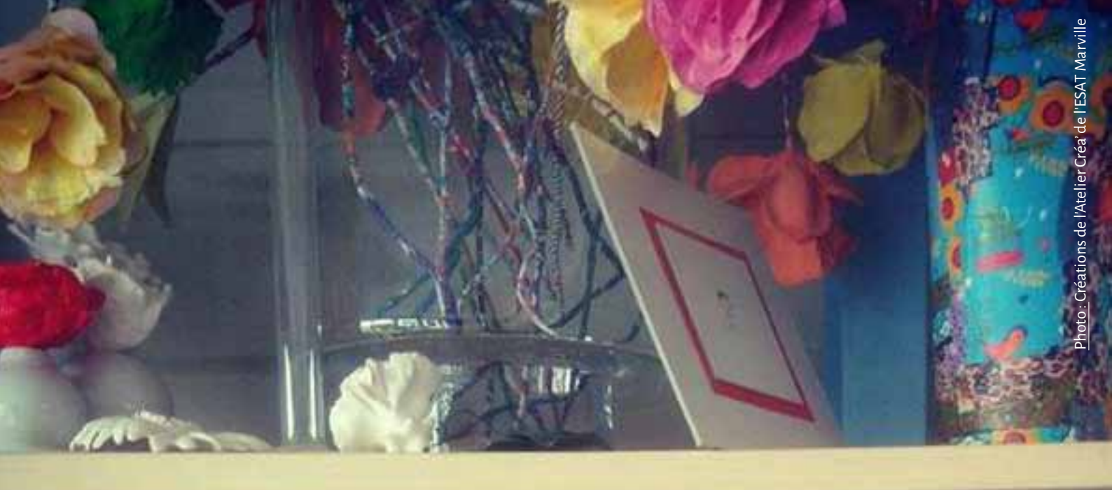
Photo : Créations de l'Atelier Créa' de l'ESAT Marville