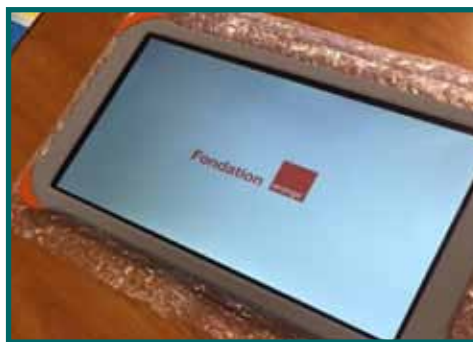
Photo : Une des tablettes du kit numérique