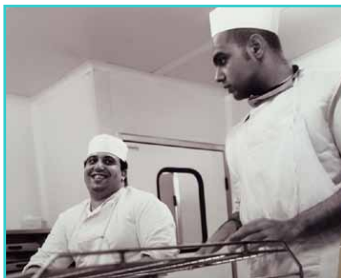
Photo : Travailleurs de l'ESAT Pleyel en cuisine

Le Restaurant L'Atelier permet une grande ouverture sur la ville. L'ESAT Pleyel, grâce à son restaurant, se fait de plus en plus connaître. D'ailleurs, les vœux du Maire de Stains ont été organisés à l'Atelier, qui a, pour l'occasion, accueilli grand nombre d'entreprises.