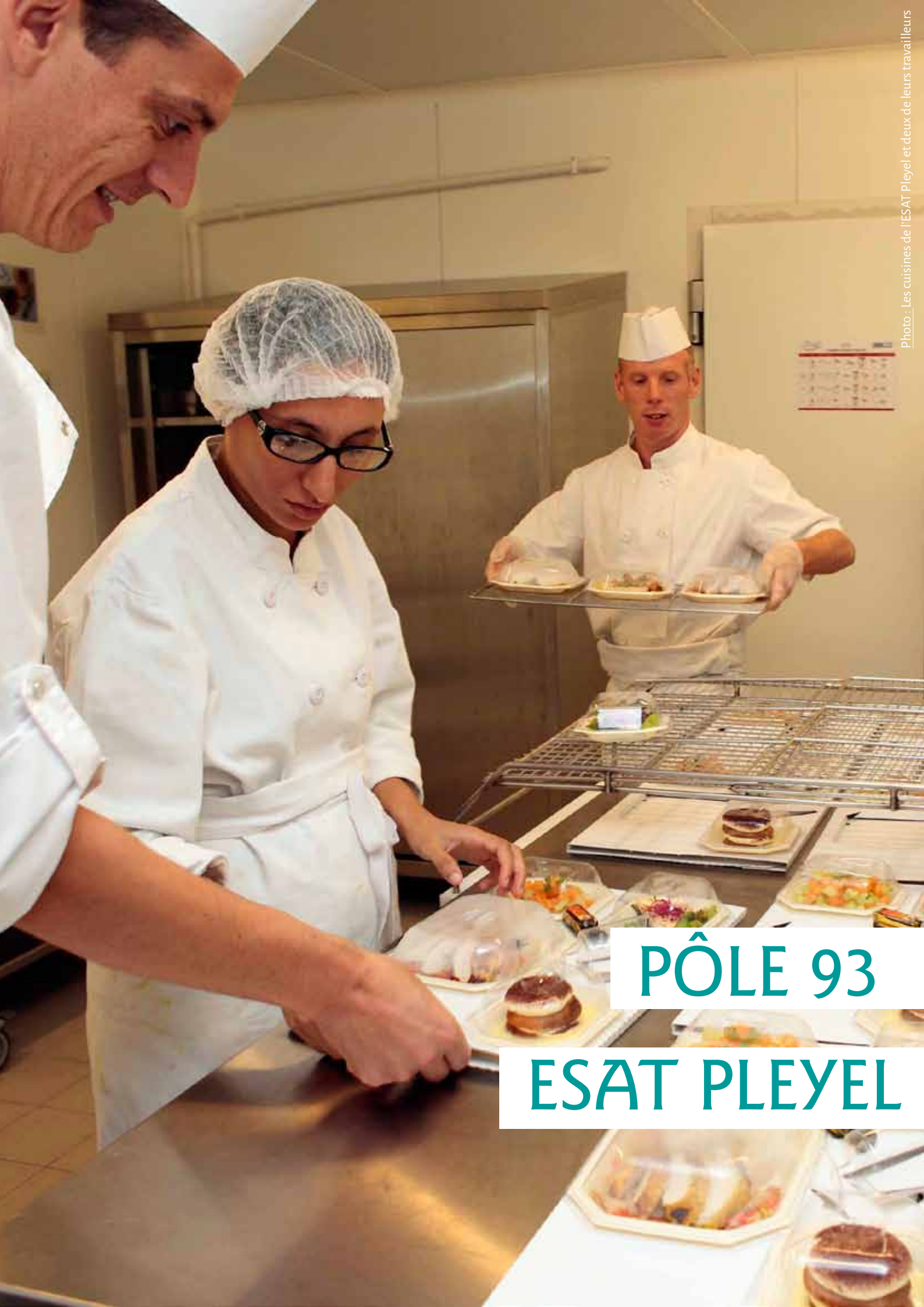
Photo : Les cuisines de l'ESAT Pleyel et deux de leurs travailleurs