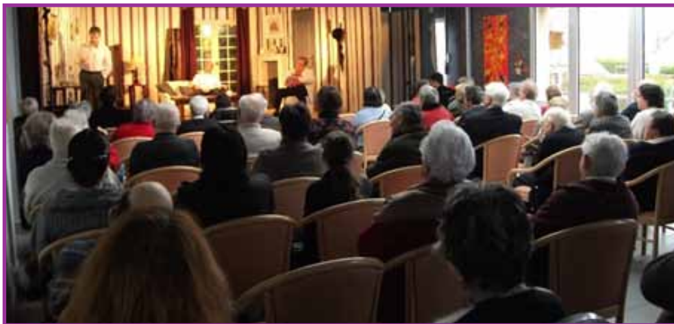
Photo : Les Artimbanques sur les planches à La Résidence Autonomie Les Jonquilles

La mise en place d'un cahier de liaison a impulsé une dynamique de transmission et de relais de l'information entre les professionnels afin de se reconnaître mutuellement dans des compétences différentes et complémentaires.