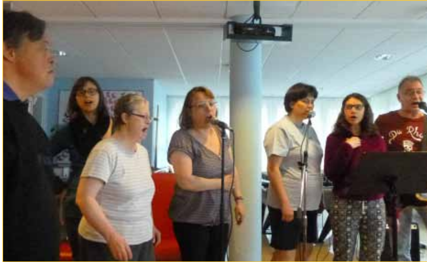
Photo : Atelier chant au Foyer l'Horizon