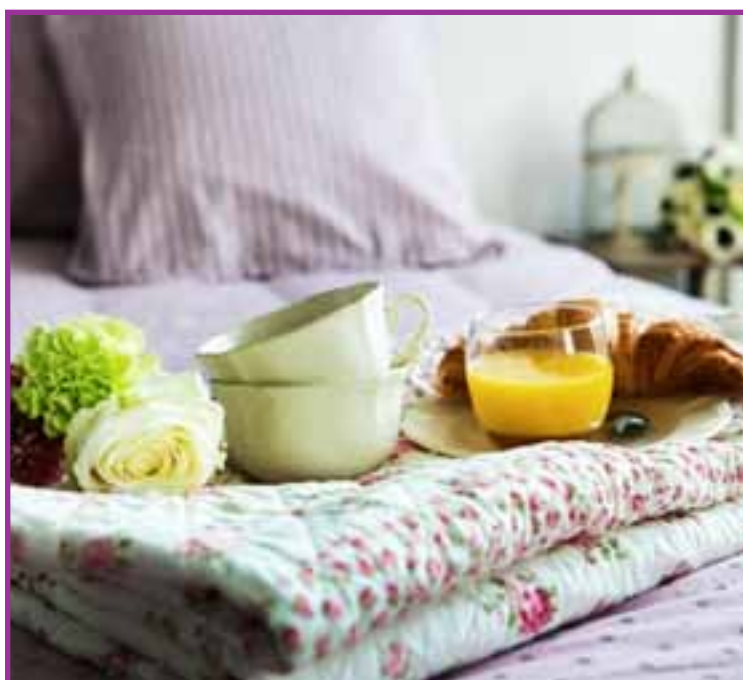
Photo : Petit-déjeuner dans une des chambres de charme du Château de Briançon

Ces travaux permettant une meilleure visibilité de l'activité et par conséquent, une allocation optimale des efforts commerciaux et financiers pour atteindre un objectif de rentabilité et une meilleure qualité de la prise en charge.