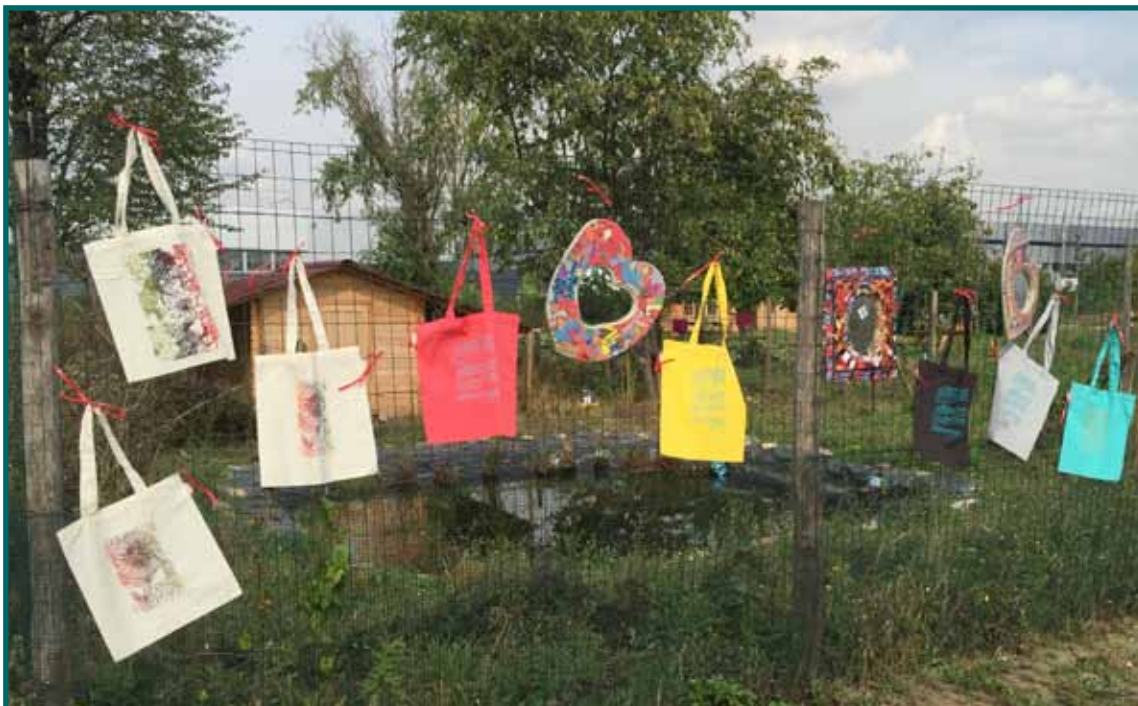
Photos: Créations de l'Atelier Créa' exposées à La Ferme Des Possibles lors de la Journée de coopération organisée par l'EINA