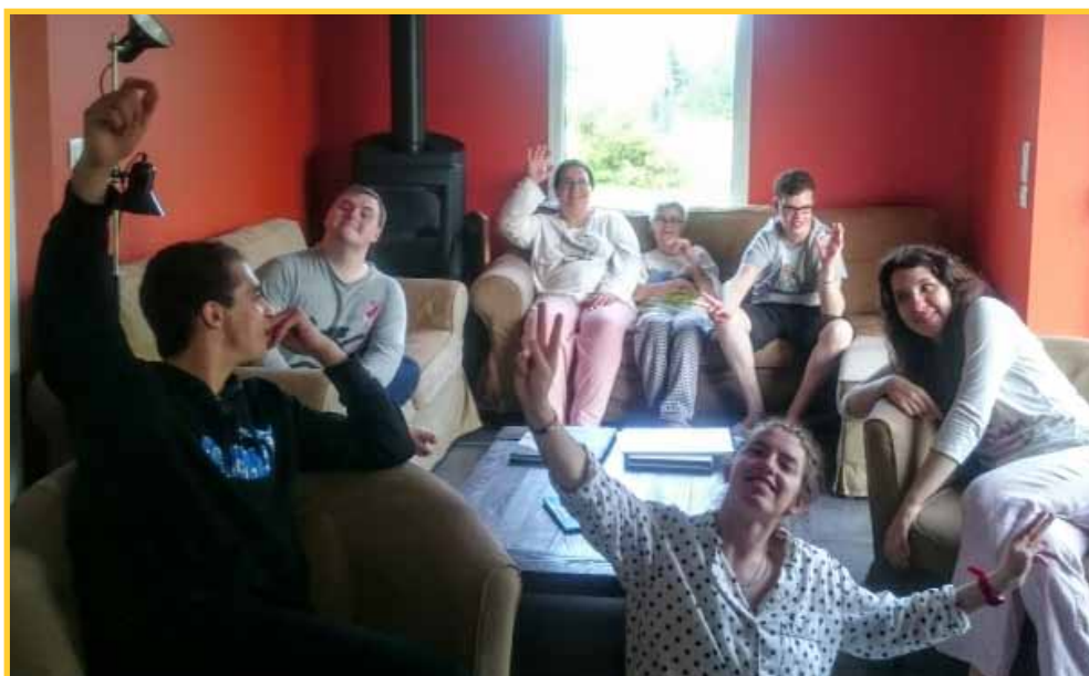
Photo : Photo prise lors du séjour à Nantes

Afin de connaître l'avis de chacun des participants au séjour, il leur a été demandé de remplir un questionnaire de satisfaction, dont les retours sont très positifs.