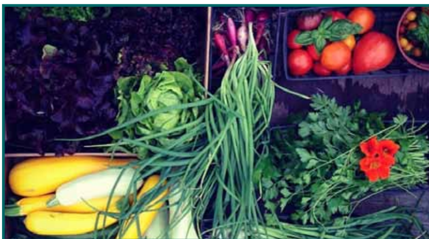
Photo : Récolte de La Ferme Des Possibles

Le 30 novembre 2016 , le projet La Ferme Des Possibles a remporté le 12ème Trophée Direction[s] et a été primé dans la catégorie «Coopération et ouverture sur le territoire». Cette remise de prix a été travaillée en amont, notamment au travers d'une journée de tournage spécialement dédiée à La Ferme Des Possibles le 4 novembre 2016 . Au programme : shooting photos, vidéo, interviews des dirigeants et success story qui ont ensuite été relayés dans le Magazine Direction[s] (Décembre 2016) et sur le site internet Direction[s]. Également, la vidéo et les photos ont été diffusées au grand public le jour de la remise de prix puis relayées sur les réseaux sociaux de La Résidence Sociale.