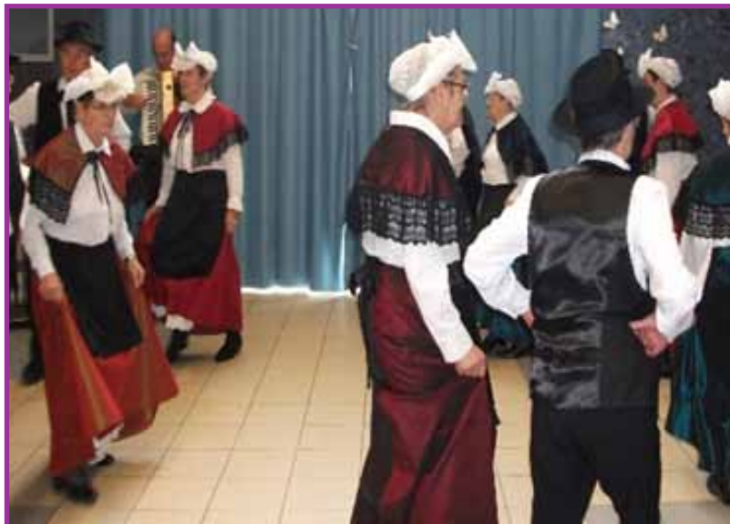
Photo : Résidents en costumes traditionnels

S'est poursuivi, le travail d'analyse de la pratique pour favoriser un travail d'équipe et de rencontres entre salariés et commencer la construction et la mise en place des Projets Personnalisés d'Accompagnement.