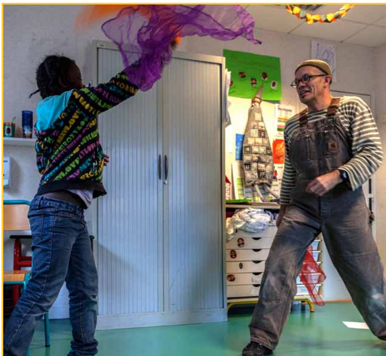
Photo : Enfant de l'EMP et un Visiteur lors d'un atelier des Clowns Chorégraphiques

L'année 2016 a véritablement été une année exceptionnelle durant laquelle chaque participant et ce quel que soit son âge et son appartenance a mis en valeur ses aptitudes, compétences, talents selon les principes et valeurs de l'Association La Résidence Sociale.