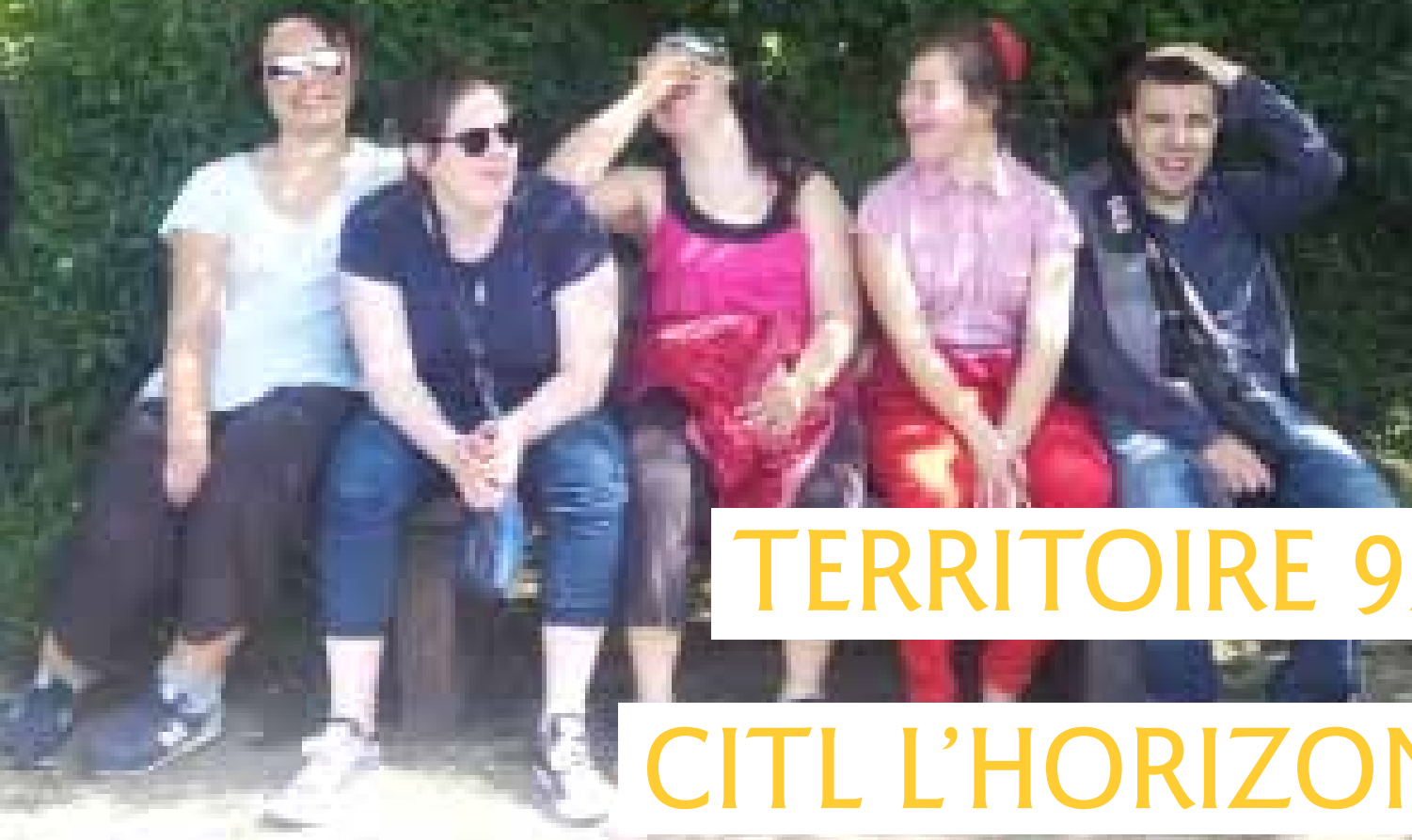
Photo : Sortie au marché au Mont Valérien