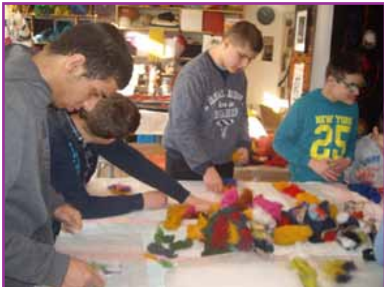
Photo : Jeunes en pleine activité lors d'un séjour adapté