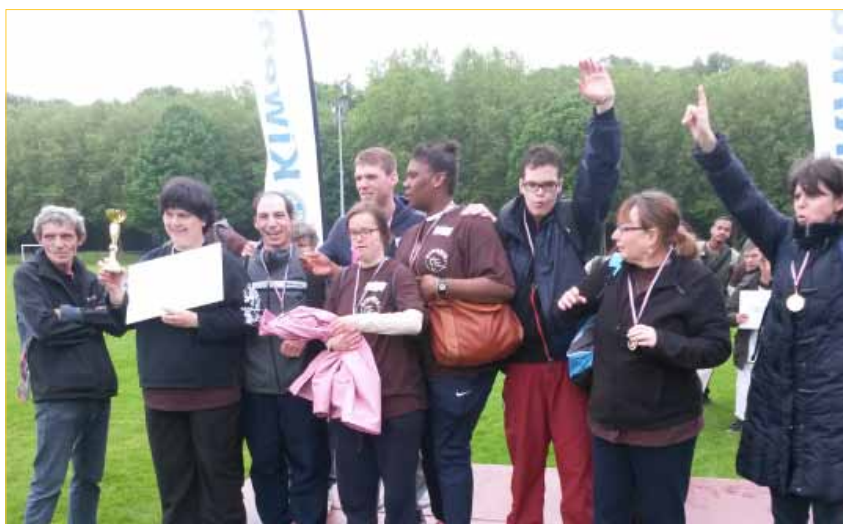
Photo : Résidents lors d'une manifestation sportive

Le taux d'occupation réel sur l'année 2016 a été égal à 92.80 % pour 8 780 journées (27 résidents au 31/12/2016 et non 30 comme prévu au budget 2016). Le prix de journée 2015 a été appliqué du 1er janvier 2016 au 31 mai 2016.