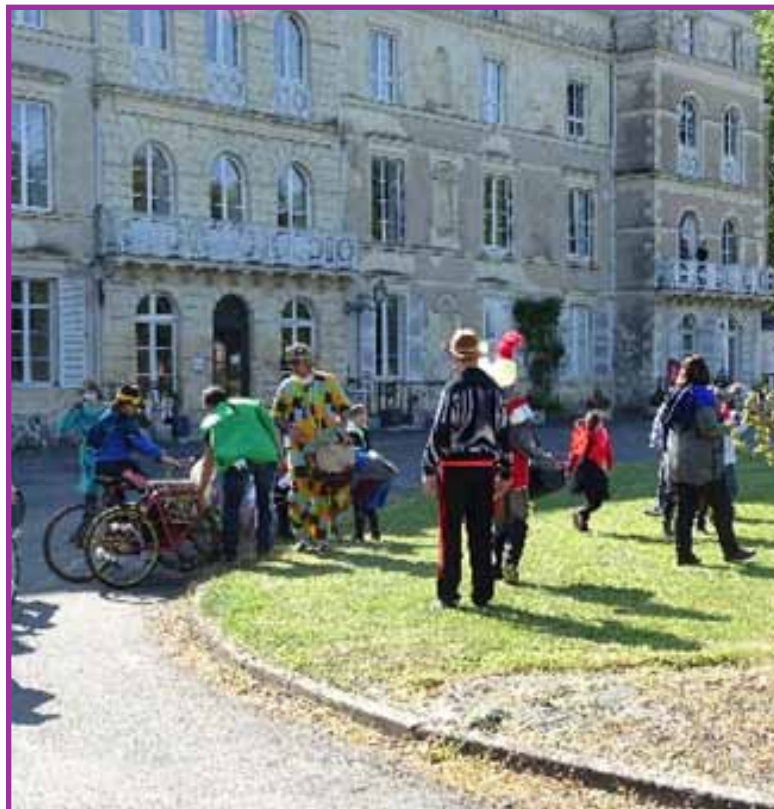
Photo : Animations au Château de Briançon

Mettre en place le dossier informatisé de l'usager, en associant les professionnels et en intégrant la nomenclature SERAFIN.